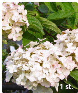
1. Syrehortensia Hydrangea paniculata Blomning: Juli–sep Växthöjd: 150–250 cm