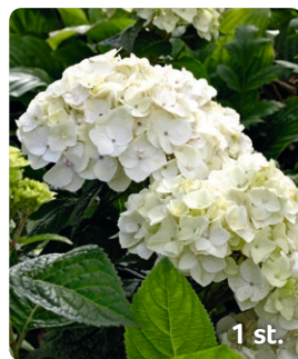
3. Trädgårdshortensia Hydrangea Endless Summer THE BRIDE Blomning: Juli–sep Växthöjd: 100–150 cm