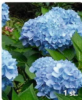
2. Trädgårdshortensia Hydrangea macrophylla 'Nikko blue' Blomning: Juli–aug Växthöjd: 80–120 cm.