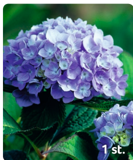
4. Trädgårdshortensia Hydrangea Endless Summer THE ORIGINAL Blomning: Juli–sep Växthöjd: Ca. 150 cm