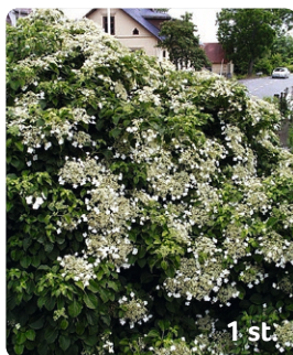
5. Klätterhortensia Hydrangea anomala ssp. Petiolaris Blomning: Juni–juli Växthöjd: 400–700 cm